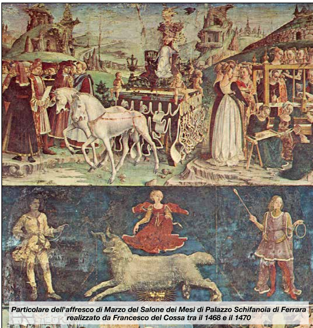
Particolare dell'affresco di Marzo del Salone dei Mesi di Palazzo Schifanoia di Ferrara realizzato da Francesco del Cossa tra il 1468 e il 1470

Marzo è un mese di passaggio. Non solo sul calendario, ma anche nello spirito delle comunità. L'inverno si ritira lentamente e lascia spazio a una stagione nuova, fatta di luce più lunga, di progetti che germogliano e di storie che tornano a muoversi. Non è un caso che proprio il 21 marzo, data simbolica di equilibrio tra giorno e notte, coincida con l'inizio della primavera e con tre ricorrenze dal forte valore civile e culturale: la Giornata mondiale della poesia, quella delle foreste e quella dedicata alle persone con sindrome di Down. Tre ambiti diversi, ma uniti da un filo comune: la cura per ciò che rende più umano il nostro vivere insieme. C'è una primavera dello sport, anzitutto, con l'Ars et Labor che riaccende una fiammella di speranza e restituisce ai tifosi il gusto della possibilità. Ma c'è anche una primavera del paesaggio e dell'impegno civile: gli alberi tartufigeni messi a dimora a Sant'Agosti-